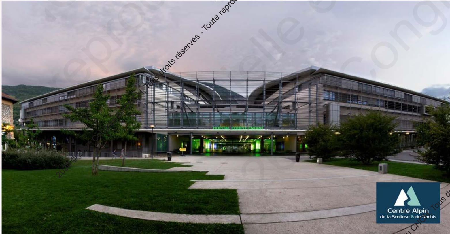
Centre Alpin de la Scoliose & du Rachis - Grenoble