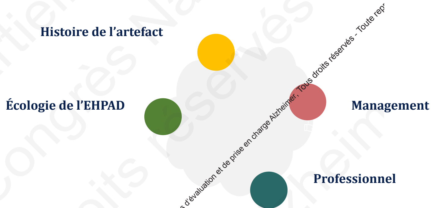
Fig. 1 : dimensions des quatre thèmes participants du processus d'appropriation